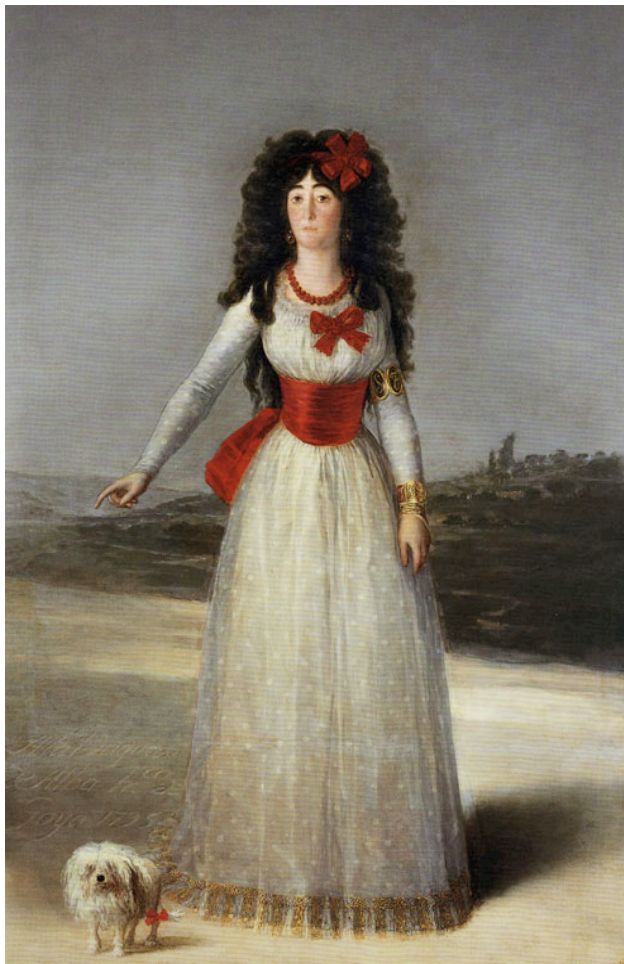
Francisco de Goya, La duquesa de Alba de blanco , 1795, Fundación Casa de Alba, Madrid.

Una experiencia única: vivir Sevilla y disfrutar la colección de la Casa de Alba en el Museo de Bellas Artes.