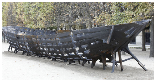
Xavier Mascaró, Departure , 2008.

La historia, el arte clásico y el contemporáneo se dan la mano en Sevilla ofreciéndonos una oportunidad de disfrute cultural única.