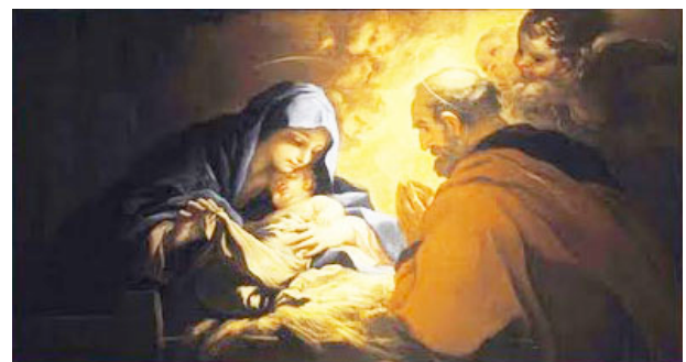
Luca Giordano, Natividad , Fundación Casa de Alba.

Ante la imposibilidad de realizar la visita a la colección de la Casa de Alba de manera guiada por normativa interna del museo, en el dossier del viaje se incluirá información detallada sobre la muestra y se aprovechará parte del trayecto de ida en AVE para explicar la colección así como las obras más relevantes. Durante la visita se podrán aclarar cualquier tipo de dudas sobre las obras ya que nuestro personal acompañará al grupo en todo momento.